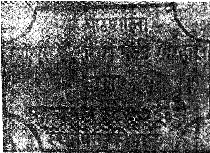
विद्यालय की स्थापना के अवसर पर लगाया गया पत्थर, जो आज भी विद्यालय में देखा जा सकता है।